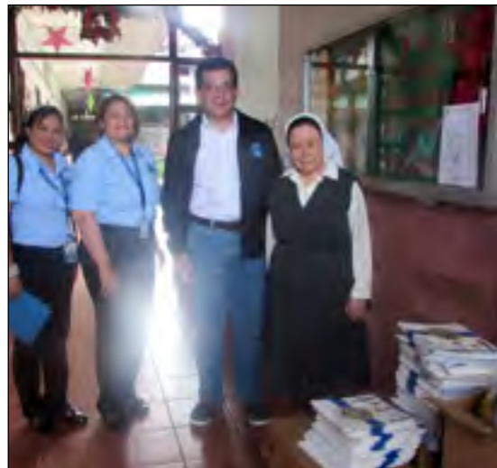
La Hermana Suárez recibe la donación.