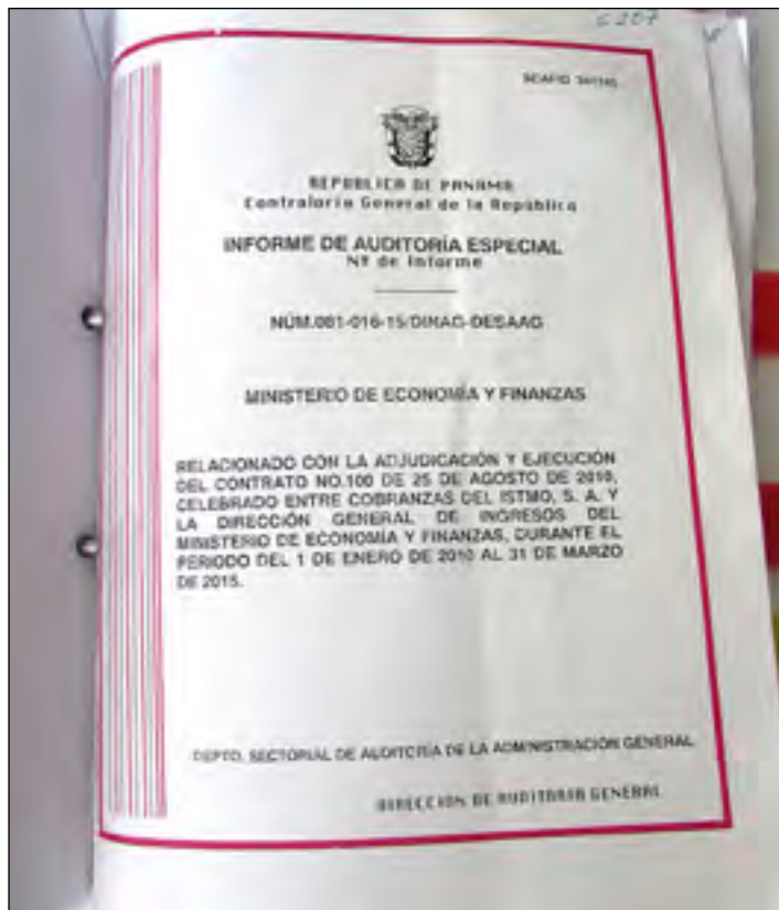
Informe de auditoría recibido del Tribunal de Cuentas.

ajustaron a los porcentajes pactados en el acuerdo fechado el 25 de agosto de 2010. El examen practicado por la Dirección de Investigaciones y Auditorías Forenses (DIAF), de la entidad encargada de fiscalizar los fondos públicos, dio como resultado el pago de comisiones por cobro de morosidad no gestionada por la sociedad anónima vinculada. Además por la duplicidad en la cancelación de comisiones, así como el pago del valor proporcionado al 50% de retención del ITBMS, situación que ocasionó un probable perjuicio económico al Esta-